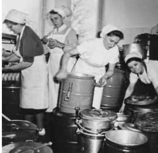
Hamburger Flutkatastrophe 1962: DRK-Helferinnen aus Hamburg-Lokstedt mit Transportkannen

Kreuzes und zum Ersten Genfer Abkommen 1864, das von zwölf Staaten unterzeichnet wird. Ein rotes Kreuz auf weißem Grund wird als offizielles Schutzzeichen eingeführt.