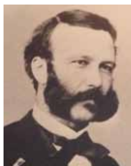
Wollte eigentlich Schriftsteller werden: Rotkreuz-Gründer Henry Dunant

Wussten Sie, dass der Gründer des Roten Kreuzes zweimal sitzenblieb und von der Schule verwiesen wurde? Henry Dunant, Genfer Kaufmannssohn, geboren am 8. Mai 1828, macht anschließend eine Banklehre, obwohl er lieber Schriftsteller geworden wäre. Danach plant er, in Algerien Weizen anzupflanzen. Da er für sein Projekt eine Wasserkonzession der französischen Kolonialverwaltung Algeriens benötigt, möchte er sich diese persönlich beim französischen Kaiser Napoleon III., der gerade auf Feldzug in der Lombardei ist, beschaffen. Dunant reist am 25. Juni nach Solferino, wo er 1859 Zeuge einer der grausamsten Kriegssereignisse des