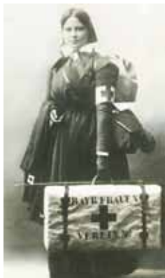
In Feldausrüstung: BRK-Rotkreuzhelferin während des Ersten Weltkriegs im Jahr 1915