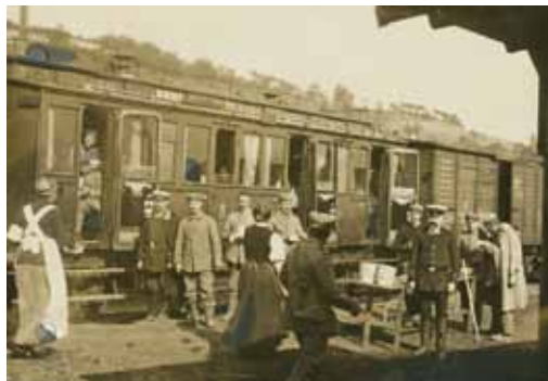
Für die ausrückenden Truppen: Mitglieder des Vaterländischen Frauenvereins versorgen Soldaten, die in den Ersten Weltkrieg ziehen.

chen helfen zu können. Auf der Grundlage freiwilliger Arbeit schließt das Rote Kreuz Lücken in der sozialen und gesundheitlichen Betreuung der Bevölkerung. ■