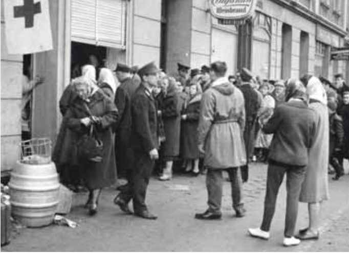
Essensausgabe: Während der Hamburger Flutkatastrophe 1962 verpflegte das Rote Kreuz viele Menschen