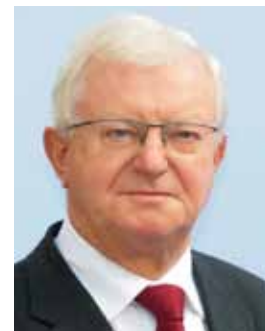
Dr. Rudolf Seiters, DRK-Präsident

Ich bin froh und dankbar, ein Bewohner dieses Hauses zu sein und wünsche Ihnen eine spannende Lektüre!